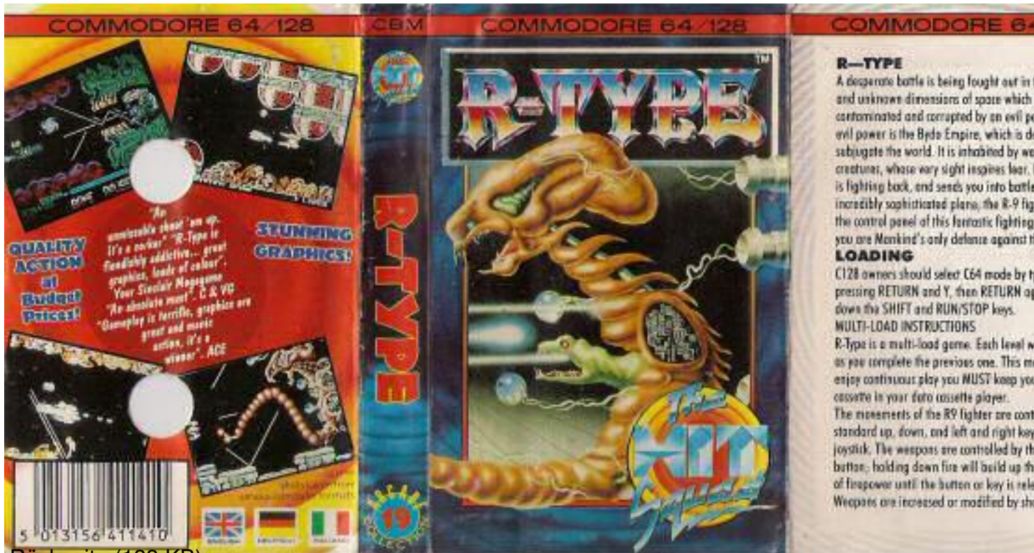
Rückseite (133 KR)

MEHRFACH-LADEANWEISUNGEN - R-Type ist ein Spiel, das mehrfach geladen wird. Jedes neue Level wird geladen, wenn das vorhergehende level erfolgreich beendet wurde. Wenn Sie ein ununterbrochenes Spiel genießen wollen, MÜSSEN Sie während des gesamten Spielverlaufes Ihre Kassette für R-Type im Kassettene recorder belassen. Die Bewegungen des R-9 Fighters werden von den Standardtasten für Hoch, Runter, Links und Rechts beziehungsweise mit dem Joystick ausgelöhnt. Die Waffensysteme werden mit dem Feuerknopf kontrolliert, wenn Sie Feuer gedrückt halten, vergrößert sich die Feuerkraft, bis Sie die entsprechende Taste oder den Knopf wieder loslassen. Die Waffensysteme werden immer größer oder modifiziert, wenn ein feindliches Raumschiff getroffen wird, das Juwelen enthält. Das Einsammeln eines Jewels wird mit der Ausstattung eines weiteren Waffensystems von der folgenden Liste belohnt.