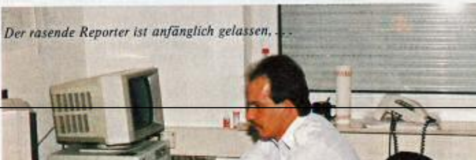
Der rasende Reporter ist anfänglich gelassen, ...