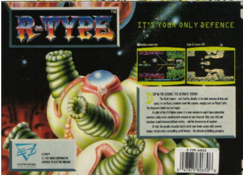
Frontside (142 KB)